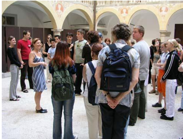
Ομάδα νέων που επισκέπτεται τον χώρο Lern- und Gedenkort Schloss Hartheim, Αυστρία, Ιούλιος 2003

Για ευνόητους λόγους, προτείνεται οι εκπαιδευτικοί να έρχονται σε άμεση επαφή με το εξειδικευμένο προσωπικό των χώρων μαρτυρίου προκειμένου να οργανώσουν τις επισκέψεις αυτές, ακόμη και στην περίπτωση που κάποιος ταξιδιωτικός πράκτορας μπορεί να συντονίσει όλες τις υλικοτεχνικές ρυθμίσεις και ν' αναλάβει τη διοικητική μέριμνα.