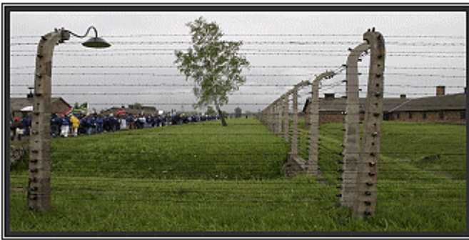
Πορεία επιζώντων στο Άουσβιτς-Μπίρκεναου, Πολωνία, 2005

Προτείνεται όπως οι εκπαιδευτικοί και οι μαθητές τους εξοικειωθούν με τους δικτυακούς τόπους μνήμης πριν τις επισκέψεις τους σε αυτούς. Η πιο ολοκληρωμένη μέχρι σήμερα πηγή μνημονικών χώρων, συμπεριλαμβανομένου ενός διαδραστικού χάρτη όλων των μνημείων του Ολοκαυτώματος, των ιδρυμάτων και των μουσείων που είναι αφιερωμένα στα θύματα του ναζισμού, μπορεί να αναζητηθεί στον ιστότοπο: www.memorial-museums.net/