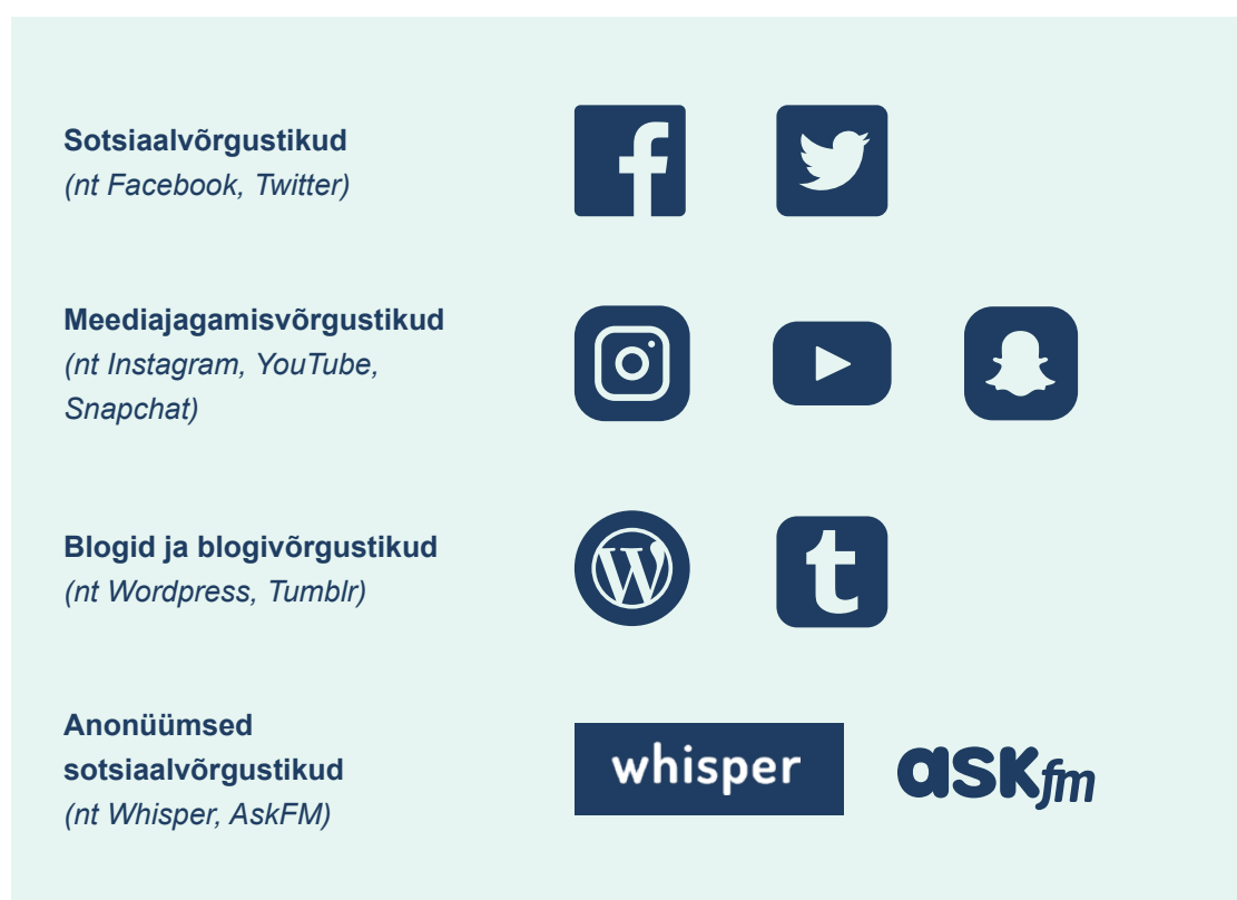
Joonis 4. Mõned sotsiaalmeediakanalite näited

Tuleks meeles pidada, et eri veebilehtede või rakenduste populaarsust ja turuosa tuleb jälgida, kuna need võivad kiirelt ja äärmiselt suures ulatuses muutuda. Teadlikkus (professionaalsetes piirides) sellest, kuidas teie õppijad sotsiaalmeediat kasutavad, võib olla oluline osa tänapäeva haridusest.